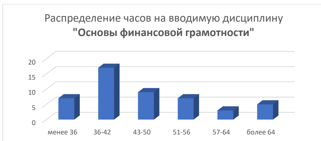
Рис. 1. Распределение количества часов на вводимую дисциплину «Основы финансовой грамотности»

Чаще всего в ПОО на дисциплину «Основы финансовой грамотности» отводится от 36 до 42 часов (35 % случаев), от 43 до 50 часов (19 %), от 51 до 56 (14,6 %), менее 36 (14,6 %).