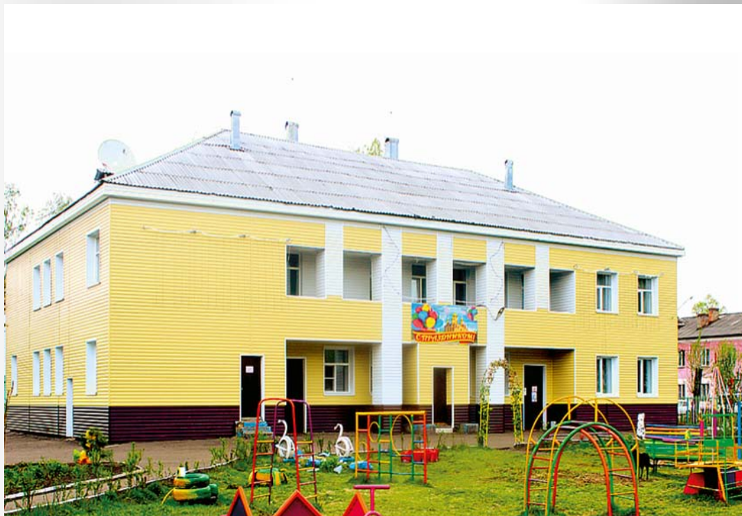
МКОУ «Детский дом» г.Осинники